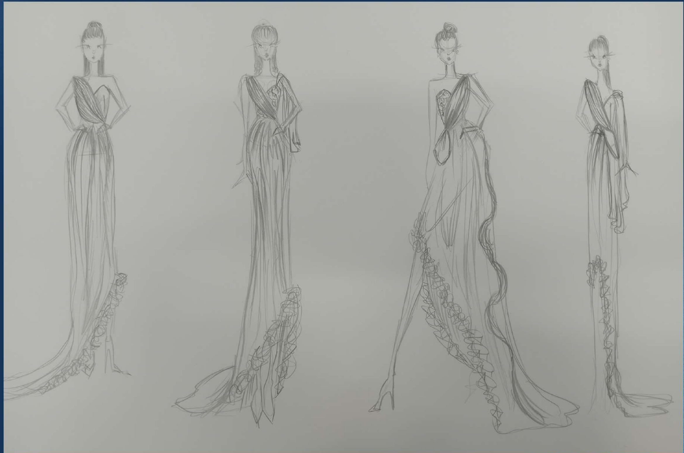
tavola degli schizzi con elementi presi dai vari progetti personali