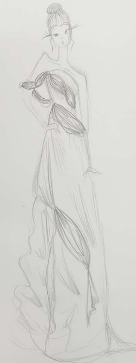
tavola preparatoria del progetto personale